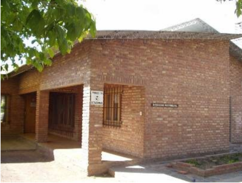
Budova fary u sv. Josefa v Malargue je vskutku velmi prostá stavba, přilehlá ke kostelu

Hned během první návštěvy jsem viděl, že pro místní obyvatele je víra v Boha opravdu živá. Podél hlavní asfaltové silnice, ale často i na vedlejších prašných cestách se na odpočívadlech či ve skalních výklencích nalézají malé i větší svatyňky obvykle s obrazem Panny Marie a drobnou výzdobou, kterou nikdo nikde neničí, ač není nijak chráněna. Na poloviční cestě mezi Mendozou a Malargue se na mírném návrší nad parkovištěm nachází zdaleka viditelná bělostná socha sv. Františka z Assisi. Zde se pravidelně kvůli nutnému oddechu zastavujeme při příjezdu i odjezdu. A hned při první cestě autem na českou stanici observatoře na návrší Coihueco jsme asi 50 km od Malargue potkali procesí poutníků na koních a na vyzdobených selských povozech tažených koňmi, kteří slavnostně vystrojeni putovali do Malargue na církevní slavnost. Těch 50 km urazili pod celodenně pražícím sluncem v pusté krajině do večera. V suché pampě navíc vítr často víří jemný prach, takže taková dvoudenní pouť znamená opravdu velkou oběť.