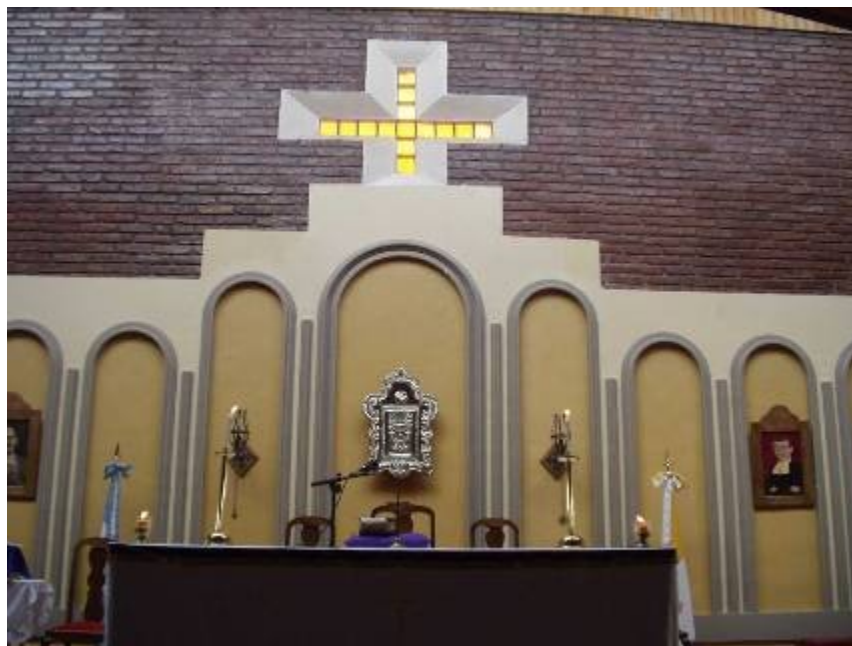
Pohled na hlavní oltář kostela v Malargue