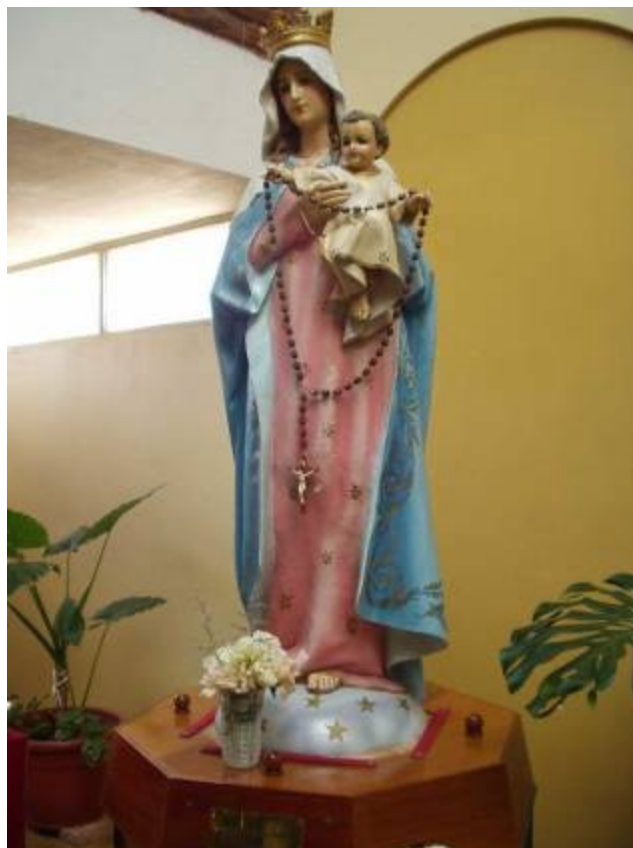
Krucifix vedle oltáře a soška Panny Marie s Ježíškem před sakristií