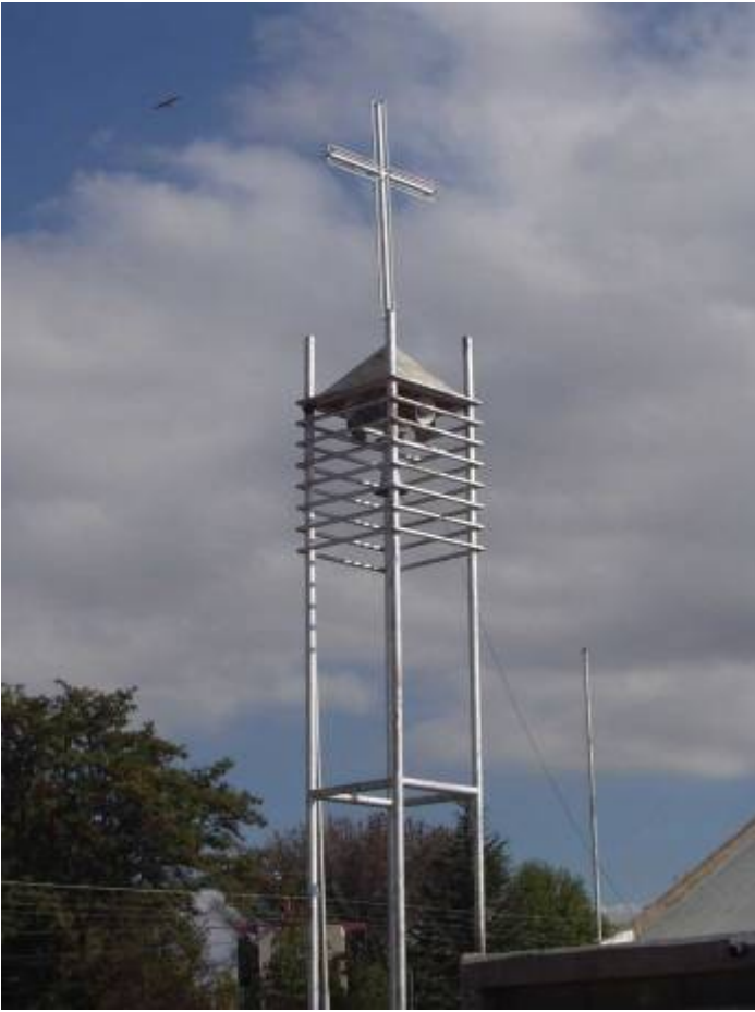
Zvonice farního kostela v Malargue