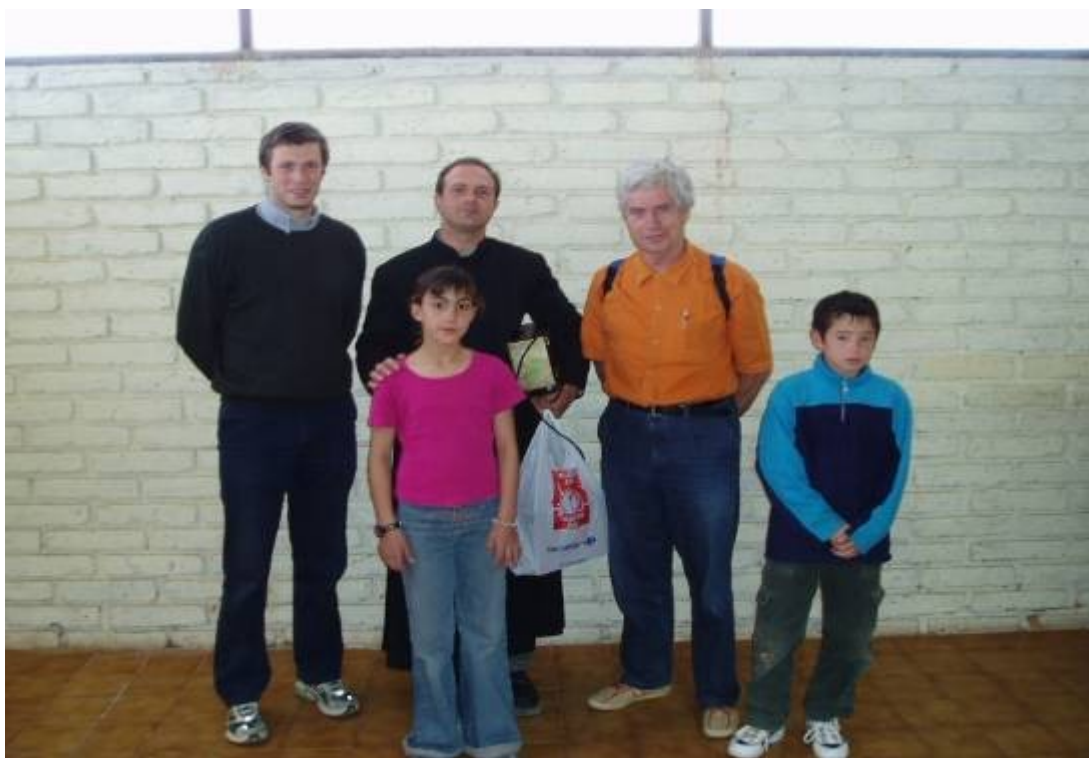
Setkání s panem kaplanem v Malargue, (svého času navštívil Meoptu v Přerově) a s jeho ministranty...