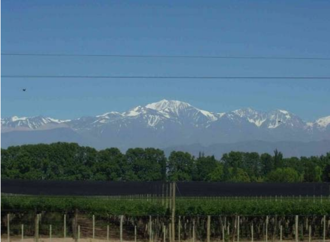
Pohled na zasněžený vrchol Aconcaguy ze silnice Mendoza – Malargue Jak patrně, pod Andami se daří (báječné) vinné révě