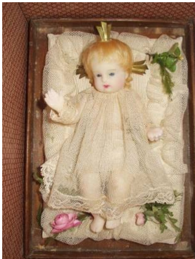
...a další Jezulátko z Prahy

Stejně tak otvírají dveře argentinských domácností fotografie Pražského Jezulátka, které tam občas vozím lidem, s nimiž jsem se blíže poznal a kteří obecně mají k cizincům a zejména k nám Čechům velmi přátelský vztah a porozumění. Nikdy jsem nečekal, že v tak vzdálené krajině a z našeho pohledu spíše polopustině s velmi nízkou hustotou nepříliš zámožného obyvatelstva najdeme tak vlídné přijetí i zájem o naši vědeckou práci.