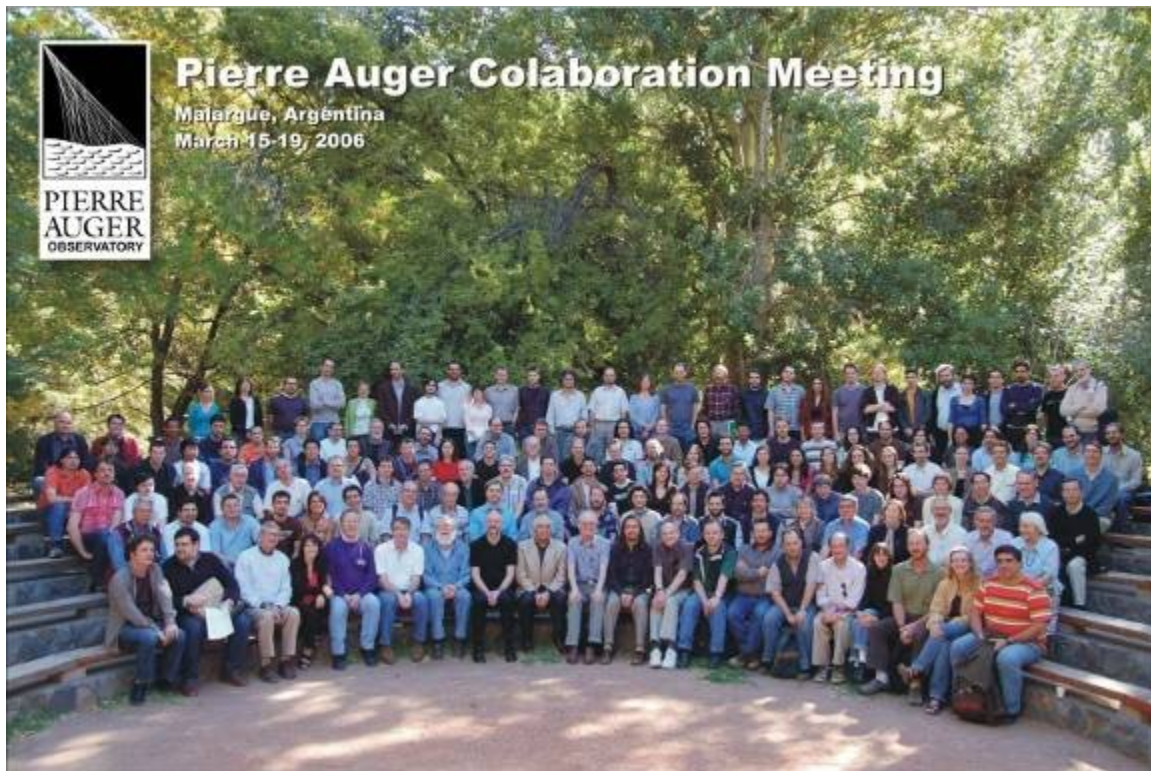
Účastníci pravidelných pracovních porad, které se v Malargue konají dvakrát ročně