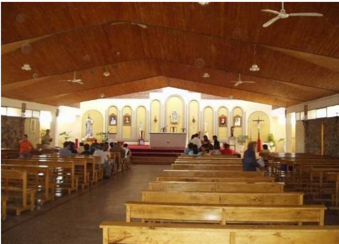
Interiér kostela sv. Josefa v Malargue