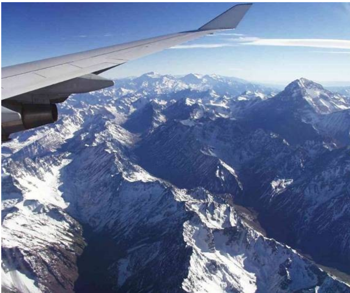
Přelet And z Mendoza do Santiaga de Chile. Vpravo vyčnívá nejvyšší vrchol obou Amerik – nádherná Aconcagua (6960 m n.m.)