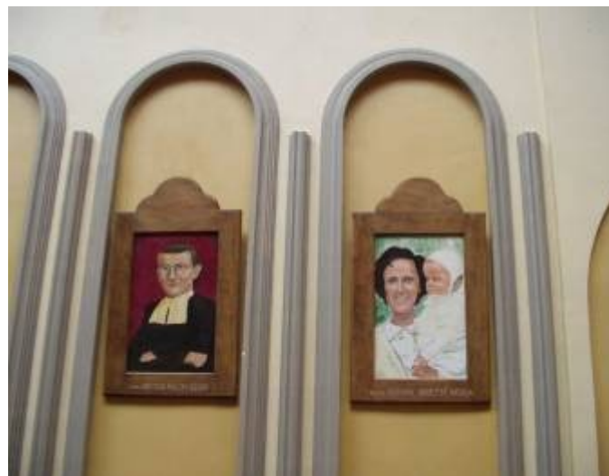
Detailní pohled na boční obrazy hlavního oltáře