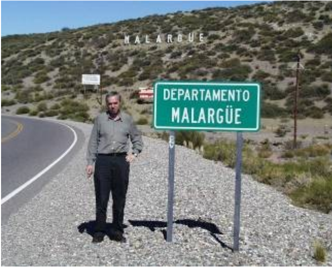
Začátek okresu Malargue poblíž Coihueca