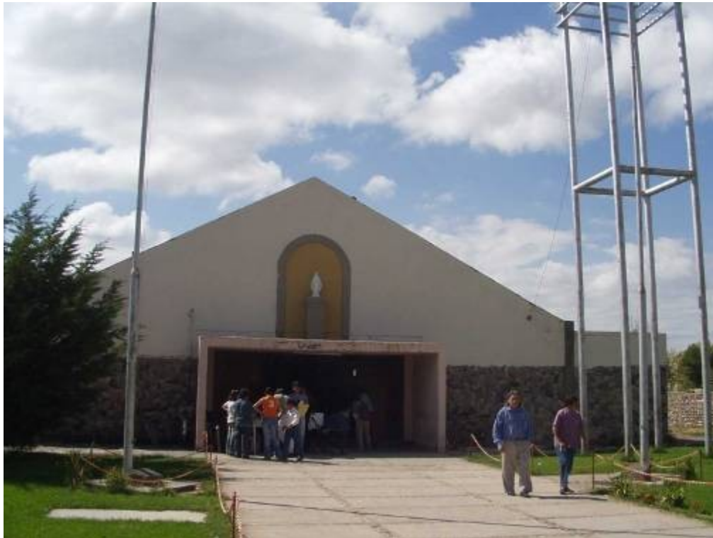
Hlavní vchod do kostela sv. Josefa v Malargue

Sám jsem na observatoři poprvé pracoval koncem r. 2002 a protože v městečku Malargue máme vždy ubytování (obvykle v soukromí), zajímal jsem se mj. o to, jak tam funguje místní farnost, což je relativně snadné, protože naprostá většina Argentinců (cca 95%) se hlásí k římsko-katolické církvi. Skutečně, hned vedle místní radnice se nachází kostel a fara u sv. Josefa a v neděli se slouží dopolední mše sv. v 9 a 11 h, kdy je rozlehlý kostel vždy zcela zaplněn, zejména záplavou dětí. Vnitřní výzdoba kostela je střídá, převažují stříbrné rámy obrazů a bohoslužebné předměty (není divu: jsme přece v Argentíně, která dostala podle stříbra své jméno). Při mši sv. se hodně a krásně zpívá; Argentinci jsou obecně velmi muzikální a temperamentní. Pozdravení pokoje se dává nejenom stiskem ruky, ale i polibky.