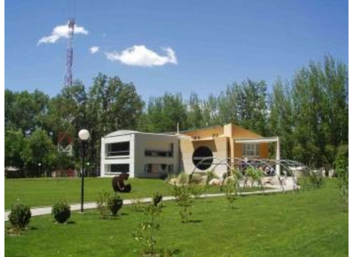
Řídící centrum Observatoře Pierra Augera