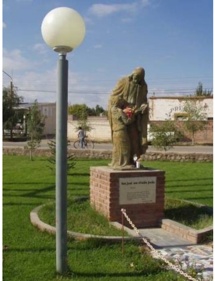
Socha sv. Josefa s Ježíškem